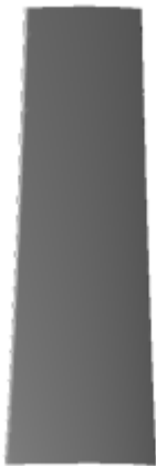
└ suction side