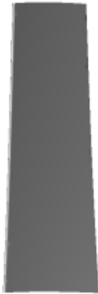
└ pressure side

The CAD model is computed with the open source code OpenMCAD [2] .