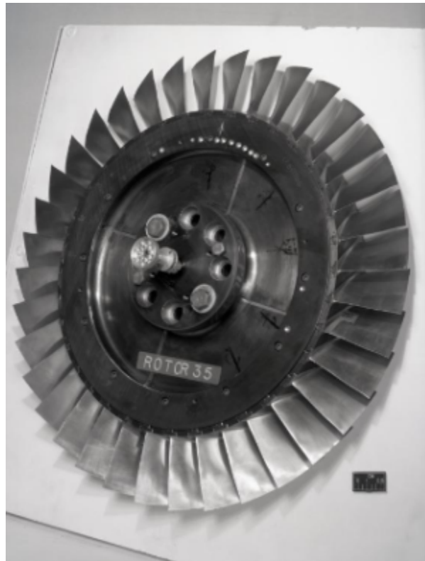
Fig. 1 https://catalog.archives.gov/id/17466807