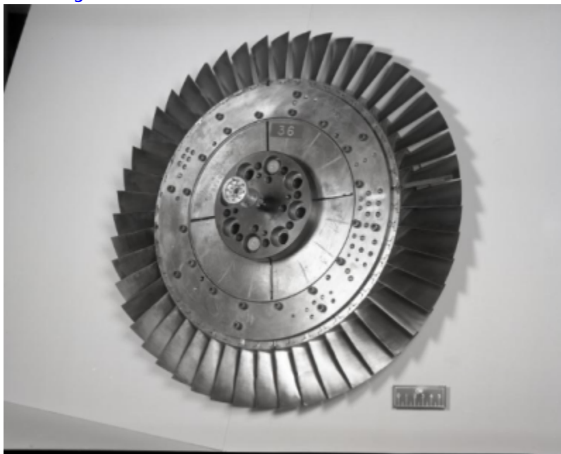
Fig. 2 https://catalog.archives.gov/id/17467884