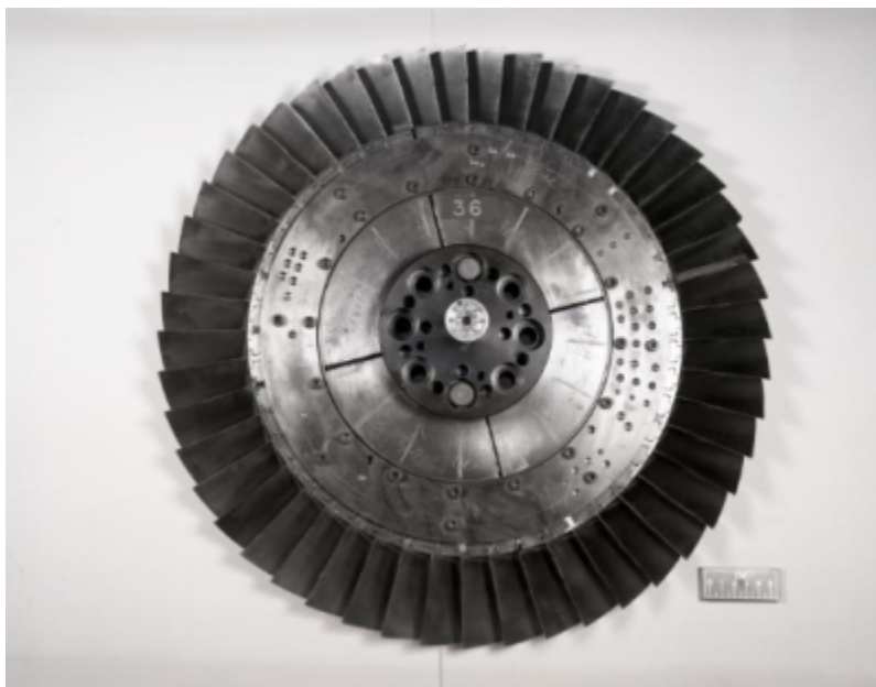
Fig. 1 https://catalog.archives.gov/id/17467913