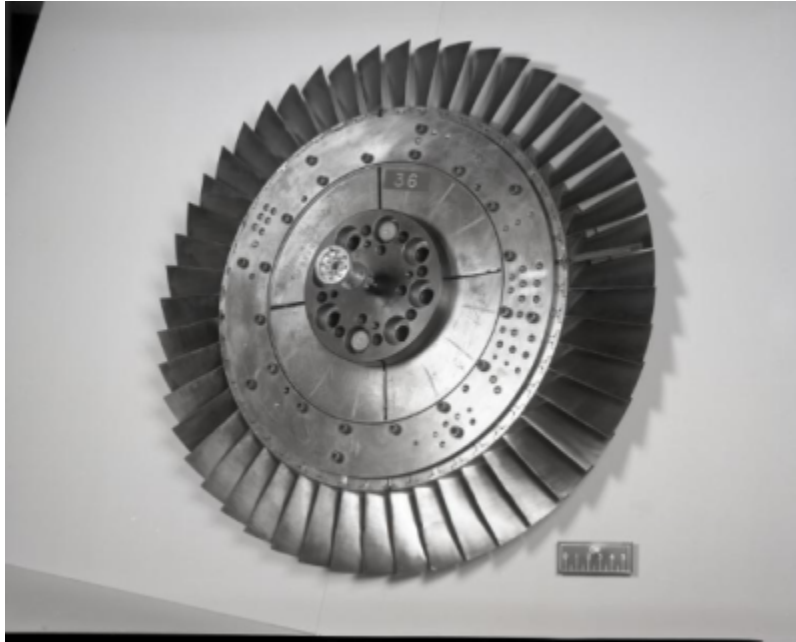
Fig. 2 https://catalog.archives.gov/id/17467884