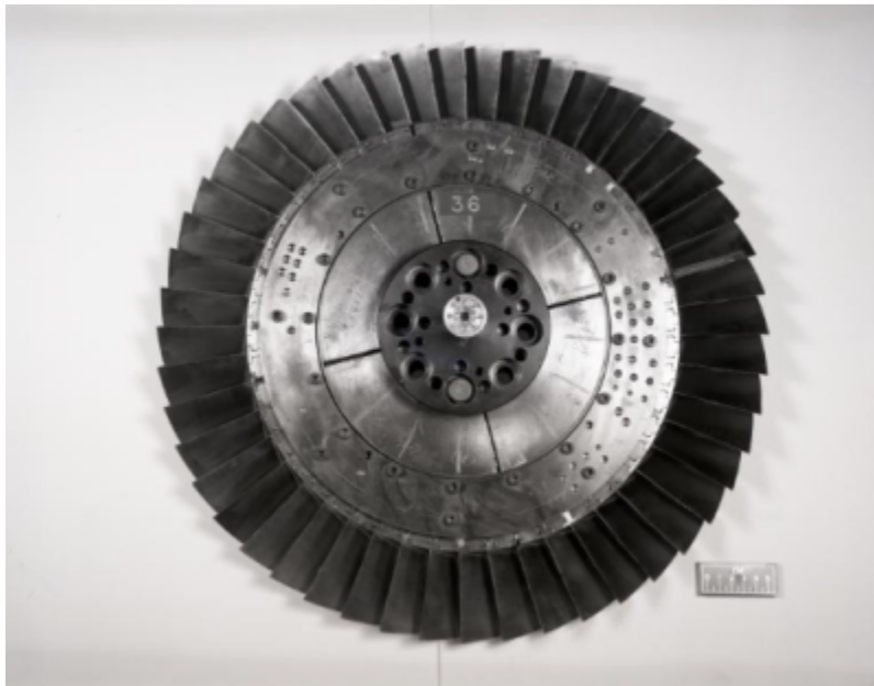
Fig. 1 https://catalog.archives.gov/id/17467913