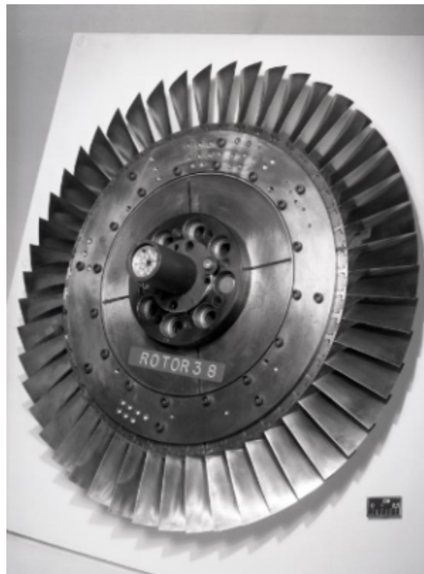
Fig. 1 https://catalog.archives.gov/id/17466806