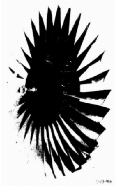
Fig1. https://ntrs.nasa.gov/citations/19740026337 p.87