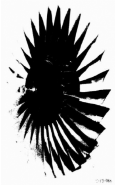
Fig1. https://ntrs.nasa.gov/citations/19740026337 p.87