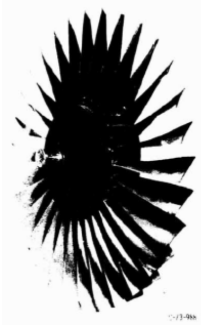
Fig. 1 https://ntrs.nasa.gov/citations/19740026337 p.87