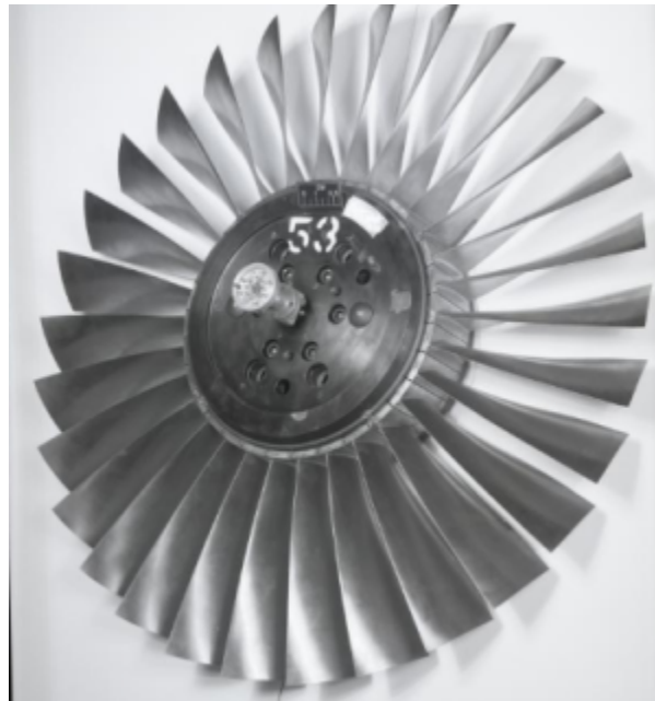
Fig. 1 https://catalog.archives.gov/id/17423389