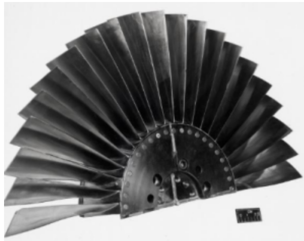
Fig. 1 https://catalog.archives.gov/id/17444857

@Misc{unknown1975records, author = {Unknown}, title = {Stage 54 rotor. {R}ecords of the {N}ational {A}eronautics and {S}pace {A}dministration, 1903 - 2006. {P}hotographs relating to agency activities, facilities and personnel, 1973 - 2013}, year = {1975}, url = {https://catalog.archives.gov/id/17444857}