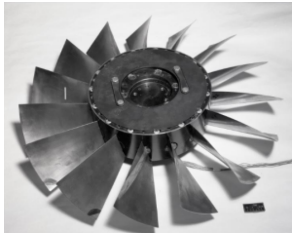
Fig. 1 https://catalog.archives.gov/id/17426841