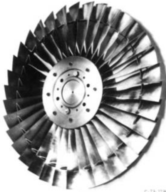
Fig1. https://ntrs.nasa.gov/citations/19760017065 p.114