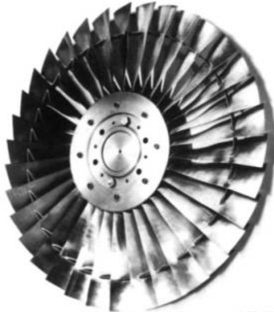
Fig1. https://ntrs.nasa.gov/citations/19760017065 p.114