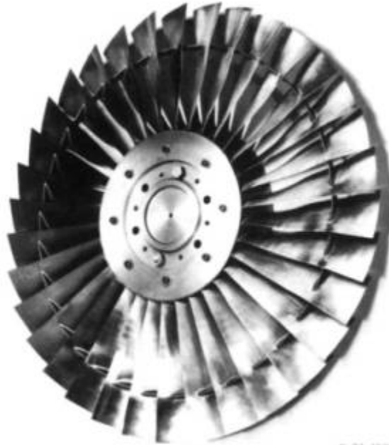
Fig1. https://ntrs.nasa.gov/citations/19760017065 p.114