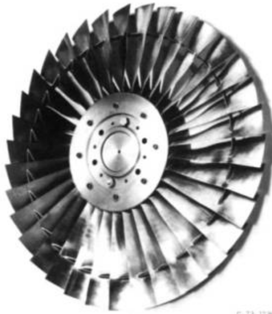
Fig. 1 https://ntrs.nasa.gov/citations/19760017065 p.114