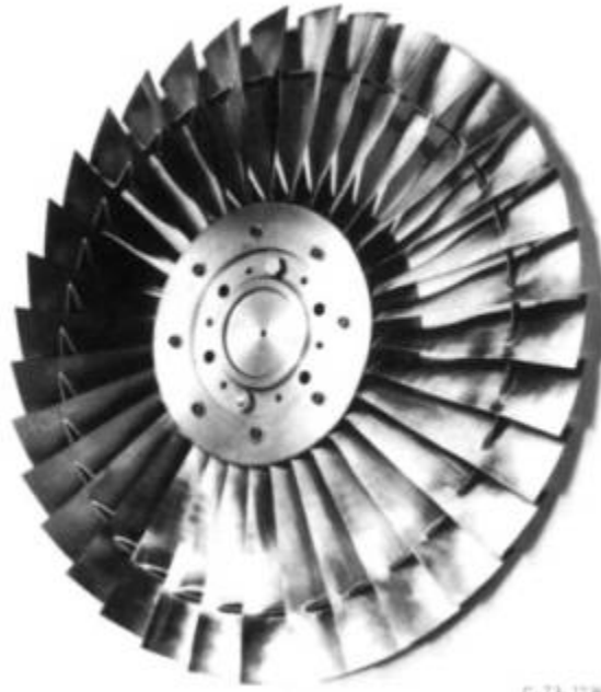
Fig. 1 https://ntrs.nasa.gov/citations/19760017065 p.114