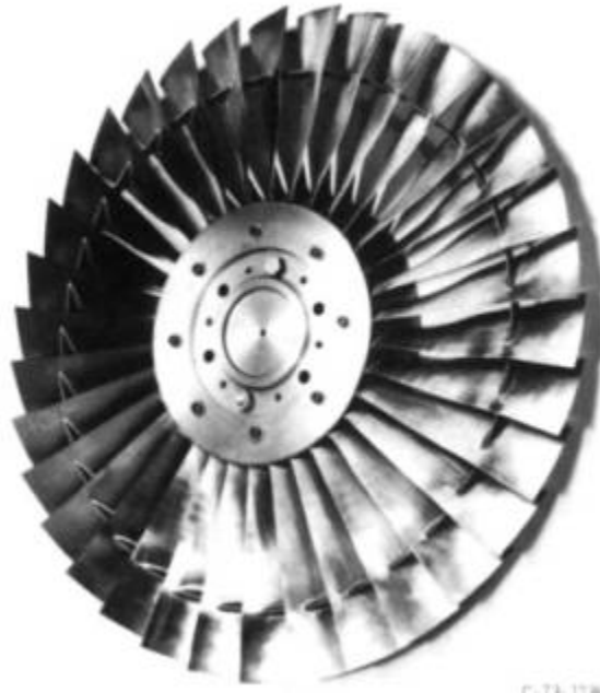
Fig. 1 https://ntrs.nasa.gov/citations/19760017065 p.114