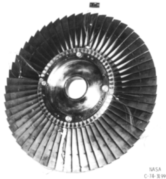
Fig. 1 https://catalog.archives.gov/id/17423368