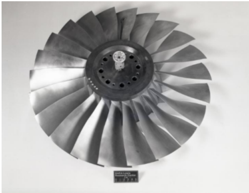
Fig. 1 https://catalog.archives.gov/id/17500556