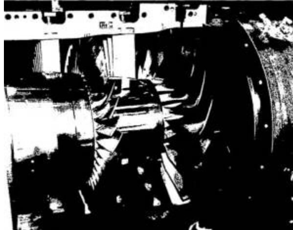
Fig1. https://ntrs.nasa.gov/citations/19790018972 p.119