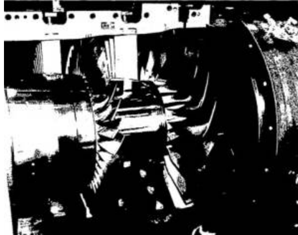
Fig1. https://ntrs.nasa.gov/citations/19790018972 p.119