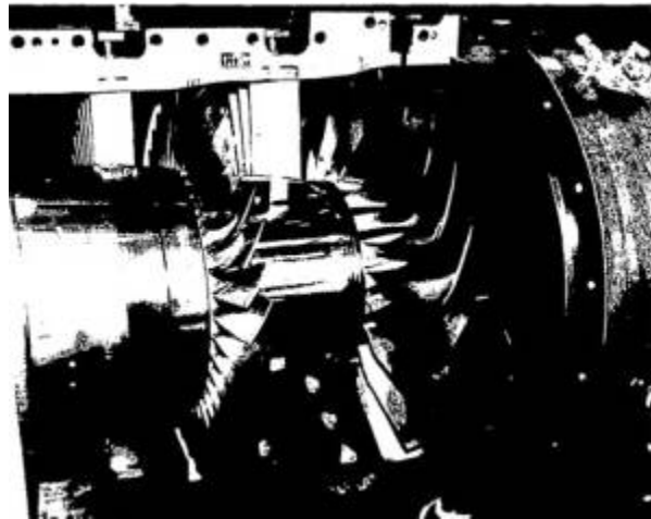
Fig. 1 https://ntrs.nasa.gov/citations/19790018972 p.119