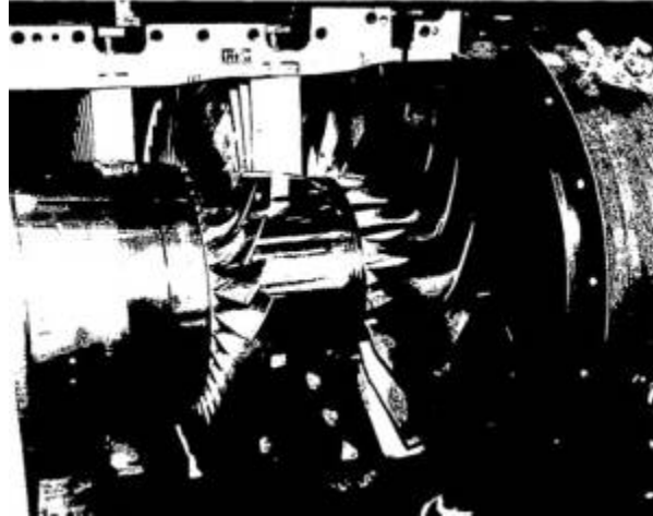
Fig. 1 https://ntrs.nasa.gov/citations/19790018972 p.119