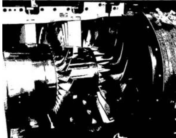
Fig. 1 https://ntrs.nasa.gov/citations/19790018972 p.119